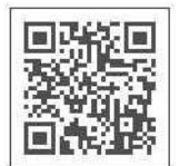
書類ダウンロード

もしくは右のQRコードを読み取り、「あじさいネット利用者登録申請書（個人・団体B）」と口座振替依頼書（個人・団体B）」のデータを印刷してください。